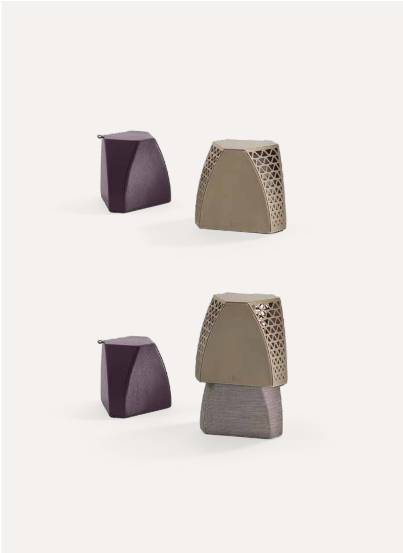
↑ ↗ Hudson coffee table, Saddle Extra Talpa